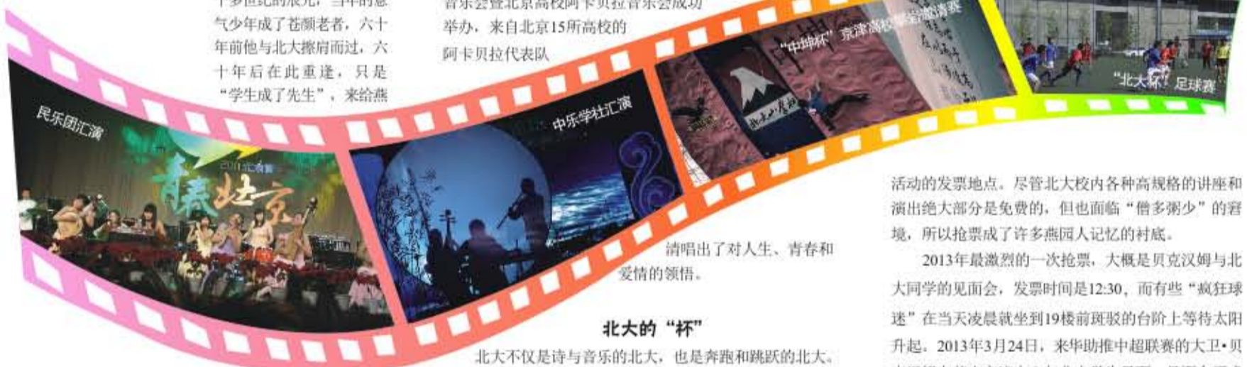
清唱出了对人生、青春和爱情的领悟。

许多从北大走出去的人怀念起这个园子的时候，除了想起一塔湖图，大概还会回忆起在19楼前排队领票的青葱岁月。19楼是北大学生会的驻地，也是许多