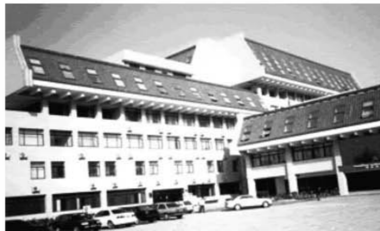
数学科学学院外景

北京大学数学科学学院以其国内一流的教学科研条件、强大的师资队伍和辉煌的历史吸引着全国最优秀的学生。在历年全国数学竞赛