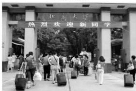
北大南门——热烈欢迎新同学