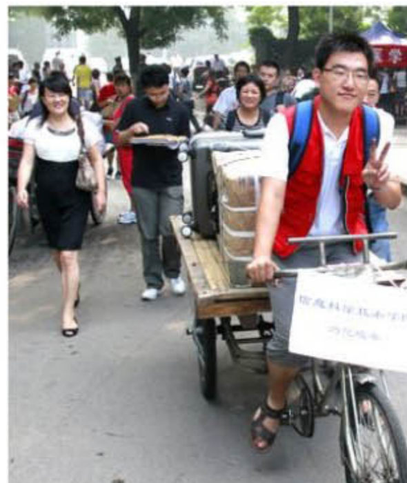
忙碌的迎新志愿者